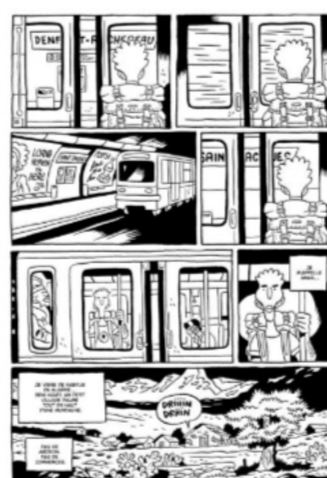
Planche de Bruno