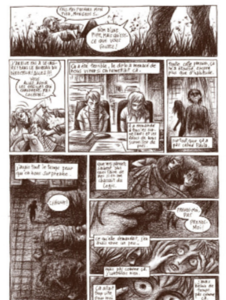
Planche d'Eddy Vaccaro

Travail collaboratif sur un scénario de Luc Brunschwig