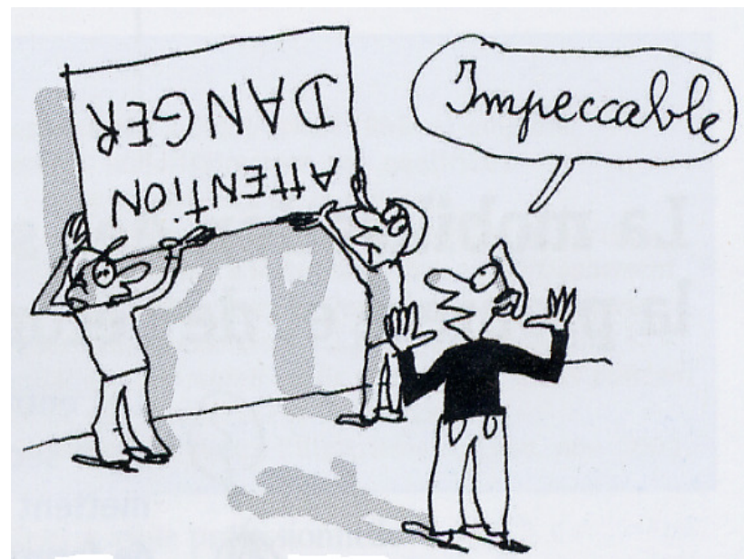
Dessin de Jacques Azam pour les éditions Milan « L'illettrisme, mieux comprendre pour mieux agir »

Réacquérir la base de la base, lecture, écriture, calcul pour être autonomes dans la réalisation des tâches simples de leur vie quotidienne